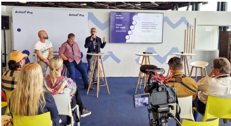
Oficiální workshop Artinii.pro a Cinemaanywhere.com v programu Cannes film festival, podium Cannes Next 2023